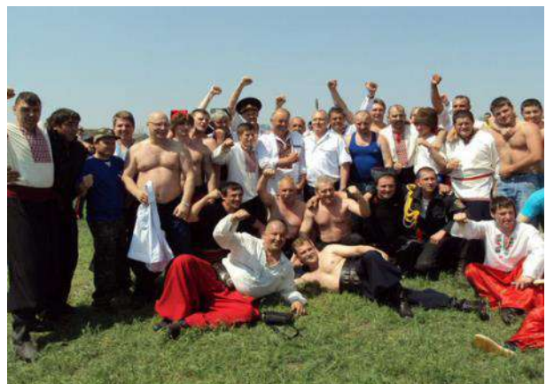
Заходи із вшанування пам'яті Кошового Костя Гордієнка на Кам'янській Січі. 01.05.2012 рік