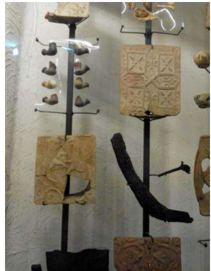
Частина еспозиції з артефактів, знайдених на території Кам'янської Січі – «Часи козацькі – Січі запорозькі» Національного заповіднику Хортиця, розміщена в одному з козацьких курінів «Запорозької Січі», відкрита 22 грудня 2016 року