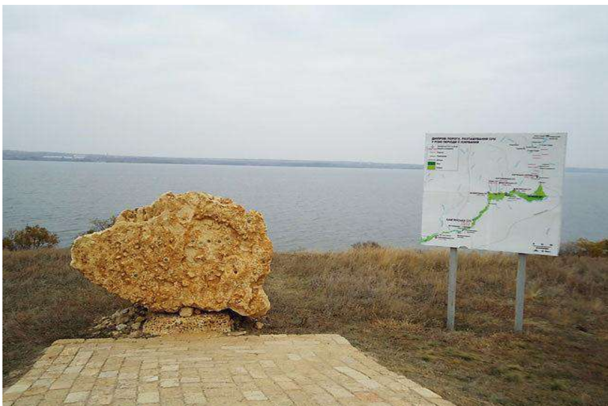
Монумент "Січі Запорозькі" з вмонтованими пам'ятними жетонами Запорозьких Січей