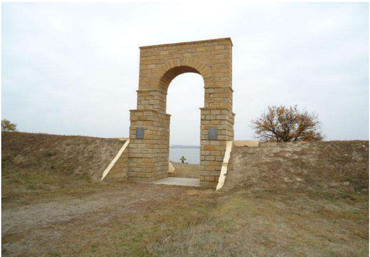
Пам'ятник кошовому отаману Кам'янської Січі – Костю Гордієнко (фото зверху) та Пам'ятна В'їзна вежа на Кам'янську Січ (фото знизу) в с. Республіканець, Бериславський район, Херсонська область