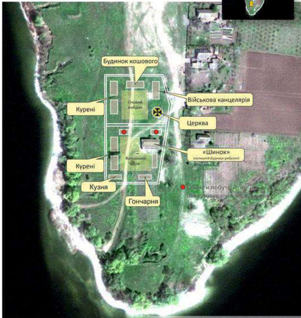
Проект благоустрою туристичної зони Філії «Кам'янська Січ», розроблений 2011 року

НЗ «Хортиця» був укладений договір оренди з Бериславським РВО на використання колишньої початкової школи в с. Республіканець під офіс філії. Новокаїрська сільська рада передала в користування безгоспний колишній будинок рибаків, в якому планувалося облаштувати адмінбудинок філії з кімнатою-музеєм Кам'янської Січі. Проводилась робота на предмет відселення 4-х садиб, які були побудовані безпосередньо на місці розташування козацьких куренів.